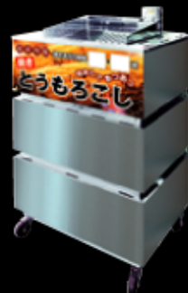
※右記はとうもろこしバージョンです。

POPはマグネット式を採用しているので用途に合わせて簡単にPOPの変更が可能です。日替わり、週替わりで販売商品を変更できるので、とても経済的です。