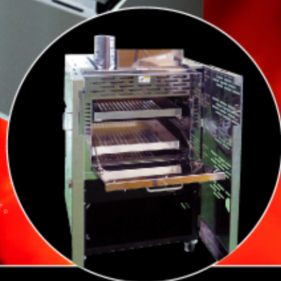
※上記写真はオプション搭載品です。